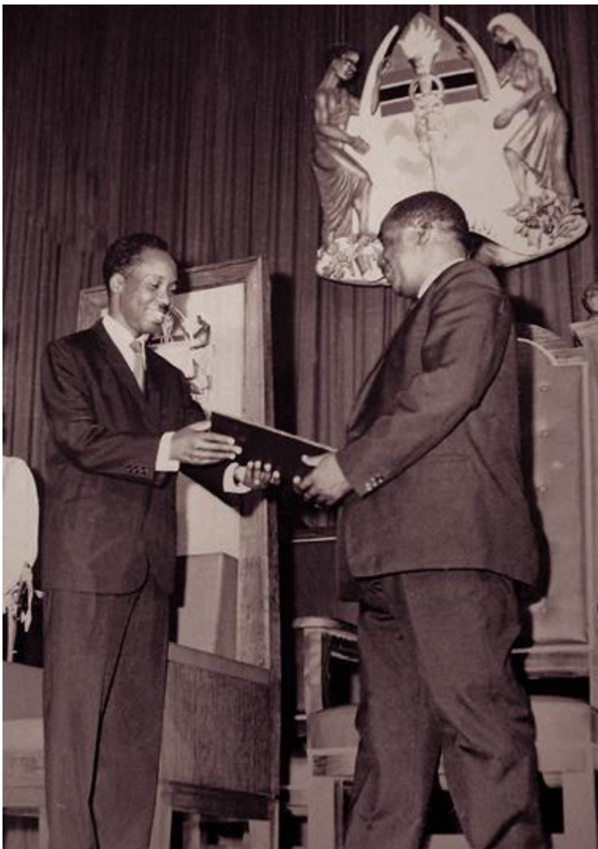
Mwalimu Julius Kambarage Nyerere (kushoto) na Sheikh Abeid Amani Karume wakibadilishana Hati za Muungano wa Tanganyika na Zanzibar tarehe 27 Aprili, 1964