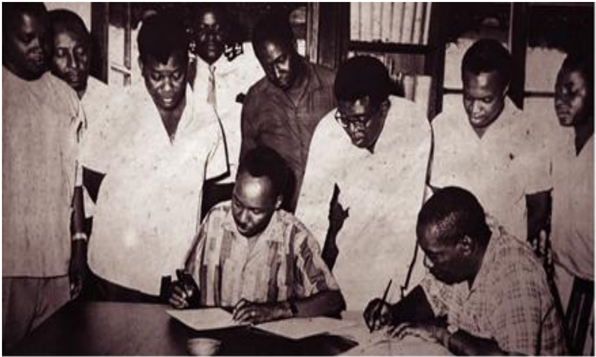
Mwalimu Julius Kambarage Nyerere na Sheikh Abeid Amani Karume wakisaini Hati za Makubaliano ya Muungano, Tarehe 22 Aprili, 1964 mjini Zanzibar. Wanaoshuhudia kwa karibu tukio hilo kushoto kwa Mwalimu ni Abdullah Kassim Hanga na kulia ni Oscar Kambona.