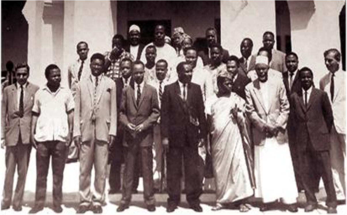
Mwalimu Julius Kambarage Nyerere, Rais wa Jamhuri ya Tanganyika na Sheikh Abeid Amani Karume, Rais wa Jamhuri ya Watu wa Zanzibar Picha ya pamoja na viongozi mbalimbaili katika Ukumbi wa Karimjee - Dar es Salaam tarehe 27 Aprili, 1964.